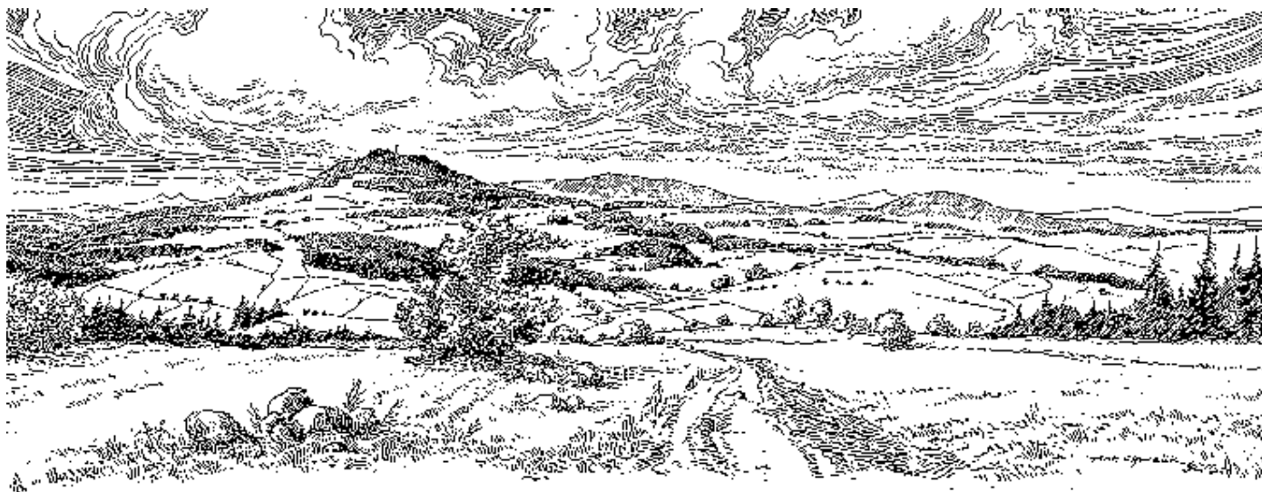
Členitá krajina Lomnická se svými kopci, údolními, hlubokými lesy a starými hrady je opředená celou řadou mystérií a pověstí, o kterých si zdejší lidé povídají již mnoho generací. (Antonín Chmelík, Pohled k Táboru)

vždy strhl na chodbách hrozný hluk, jako by někdo sudy válel. Všichni obyvatelé tvrže hlomoz slyšeli, ale nikoho nikdy nespatriili.